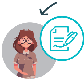
Le collaborateur ou la personne de confiance